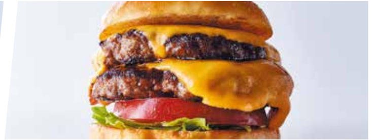
ダブルチーズバーガー ¥1400