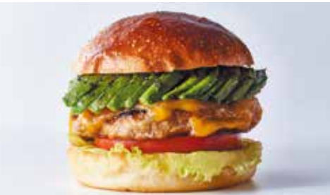
ポークアボカドチーズバーガー ¥600