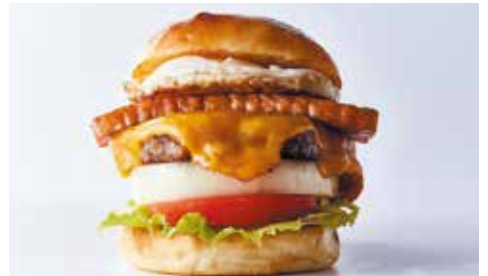
ベーコンチーズエッグオニオンバーガー ¥1300