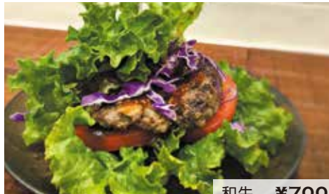
和牛 ¥700 ポーク ¥500